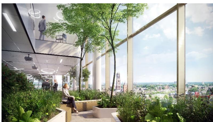
Afbeelding 5 & 6: Renders van het toekomstige 'Central Park'.