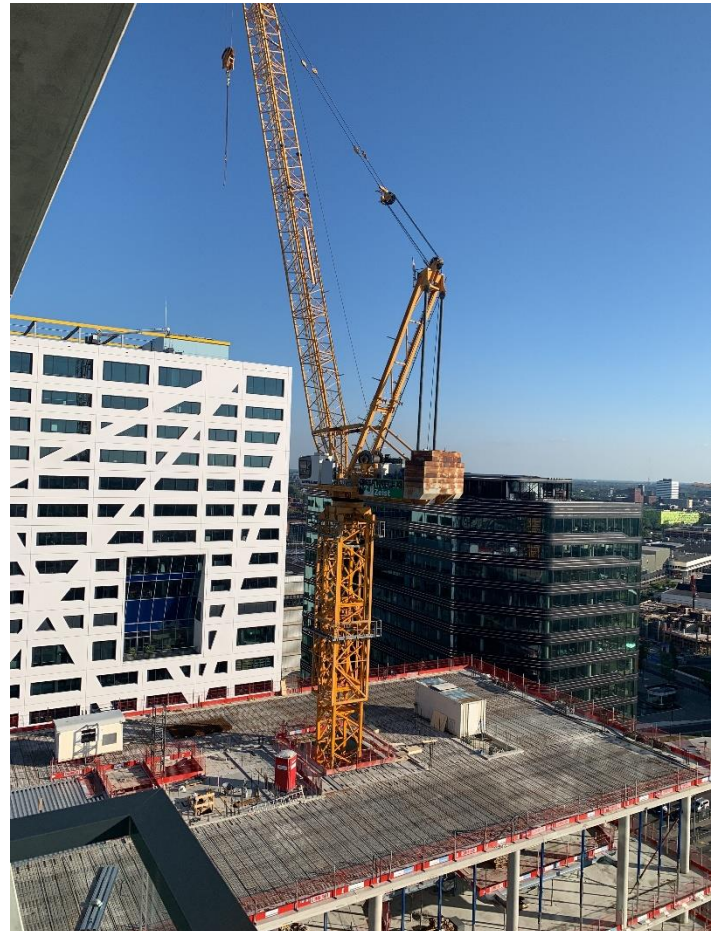
Foto 2: Foto vanuit woontoren 'De Syp' met zicht op Central Park.