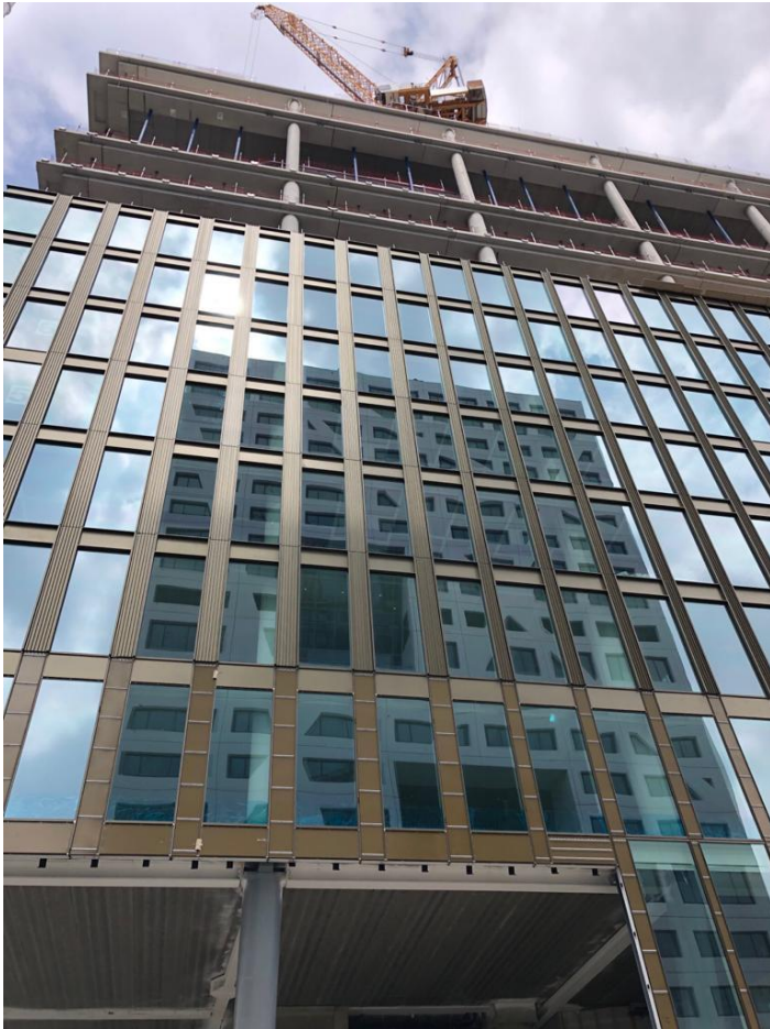
Foto 3: Ook op een bewolkte dag is een mooi lijnenspel zichtbaar op de gevel van Central Park.