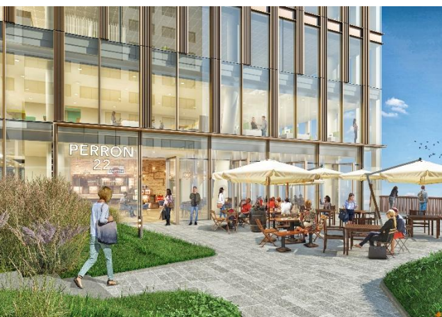
Afbeelding 1: Een impressie van het toekomstige kantoorplein.

De betonstort staat gepland nog dit voorjaar. Zodra de definitieve datum is vastgesteld zullen wij u hierover informeren.