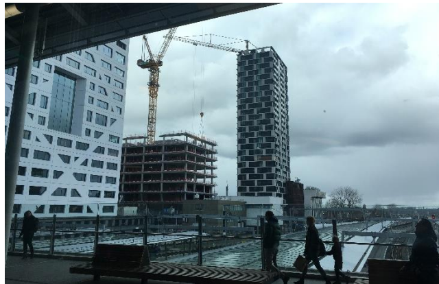
Afbeelding 5: zicht op Central Park vanuit Utrecht Centraal Station.