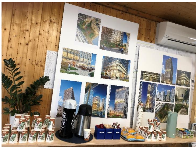
Afbeelding 3: Alles staat gereed om de bewoners tijdens de informatiebijeenkomst te ontvangen.