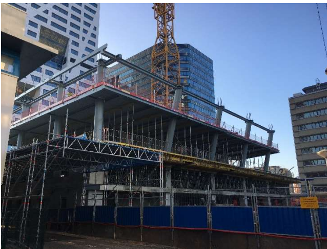
Afbeelding 8: De eerste twee lagen van de toren worden gebouwd in staal.