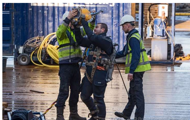
Afbeelding 2&3: Een duiker wordt voorzien van uitrusting.