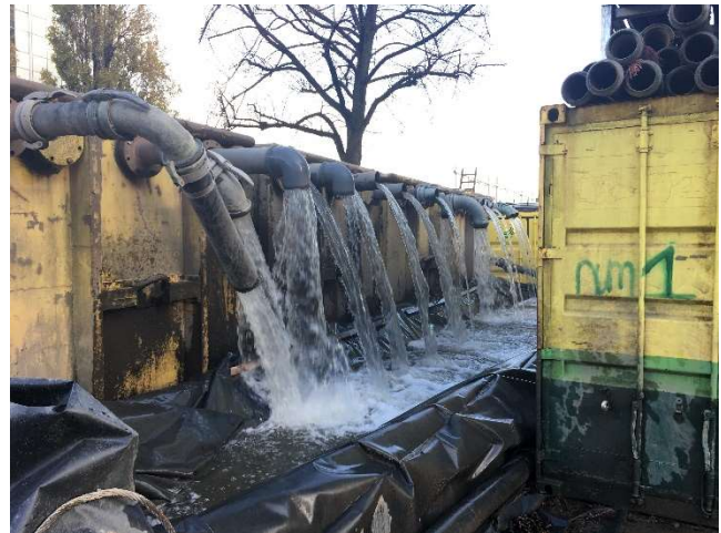
Afbeelding 5: Het afgezogen water en zand wordt geloosd in een bassin. Daarin bezinkt het zand, het water stroomt terug naar de bouwkuip.