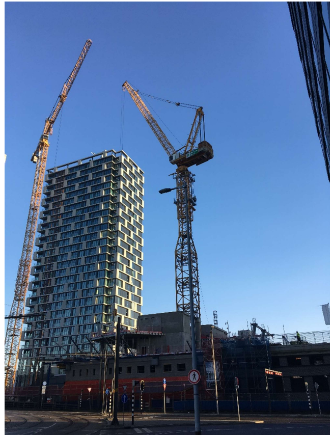
Afbeelding 9: Een overzichtsfoto van het bouwterrein. Links de woontoren De SYP en rechts de contouren van de kantoorstoren Central Park.