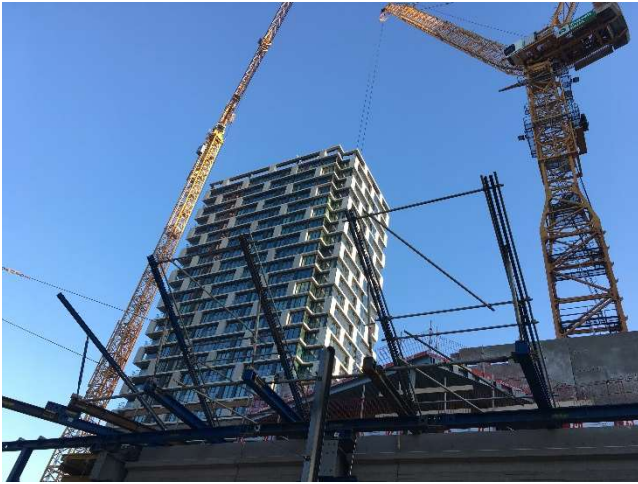
Afbeelding 7: Ter plaatse van de Mineurslaan wordt een veiligheidsscherm gebouwd.