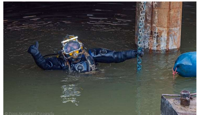
Afbeelding 1: Een duiker voorafgaand aan de afdaling in de bouwkuip.

Deze zijn volledig weggewerkt onder het maaiveld en de gebouwen van Central Park zodat de ruimte op het maaiveld gebruikt kan worden voor het wandelend publiek.