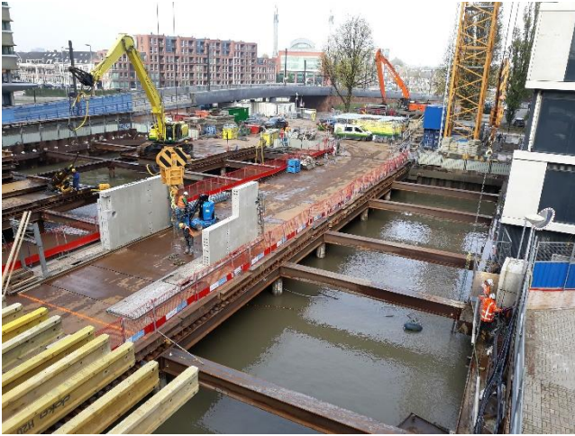
Afbeelding 5: De aanvoer van geprefabriceerde elementen via de werkbrug.