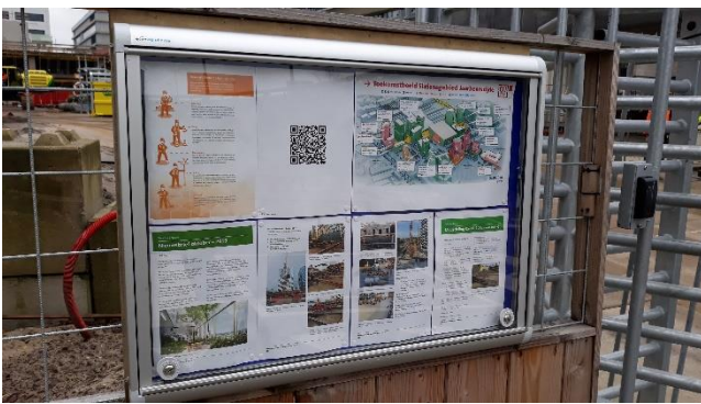
Afbeelding 6: Bij de ingang van het bouwterrein is een vitrine geplaatst met als doel om ook voorbijgangers te informeren over de werkzaamheden.