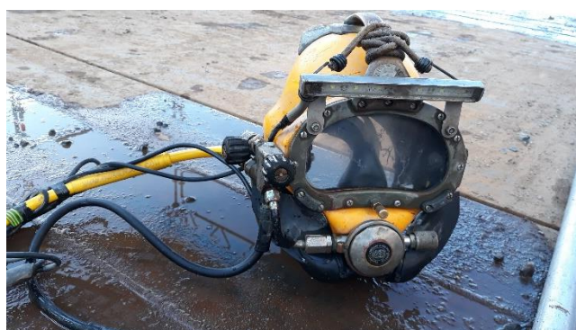
Afbeelding 4 en 5: Dagelijks gaat een duikploeg het water in voor de onderwaterwerkzaamheden (palen schoonmaken, laswerk, fundering aanbrengen).