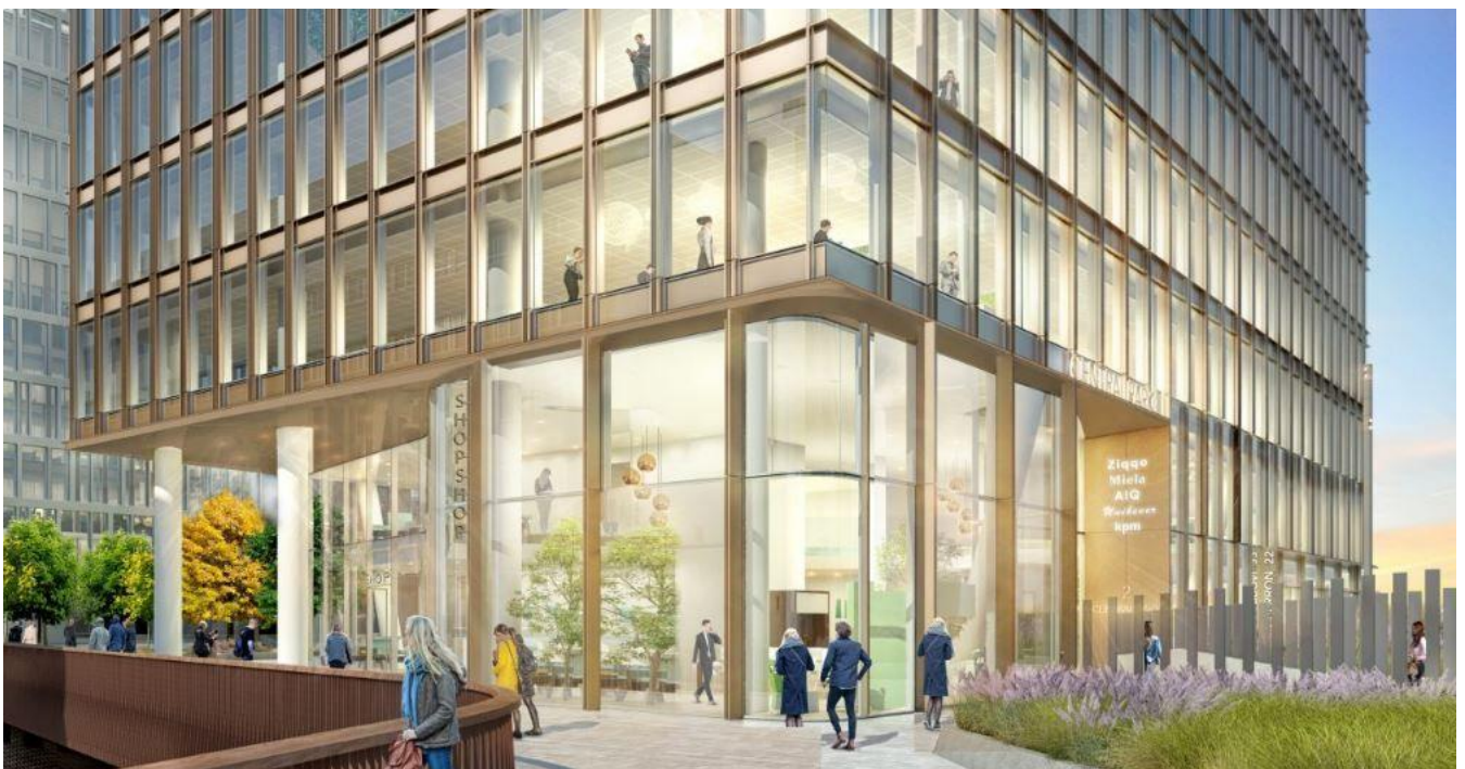
Afbeelding 1: Een impressie van de kantoorstoren Central Park.

Heeft u vragen of opmerkingen? Laat het ons weten, zie daarvoor de contactgegevens onderaan de nieuwsbrief.