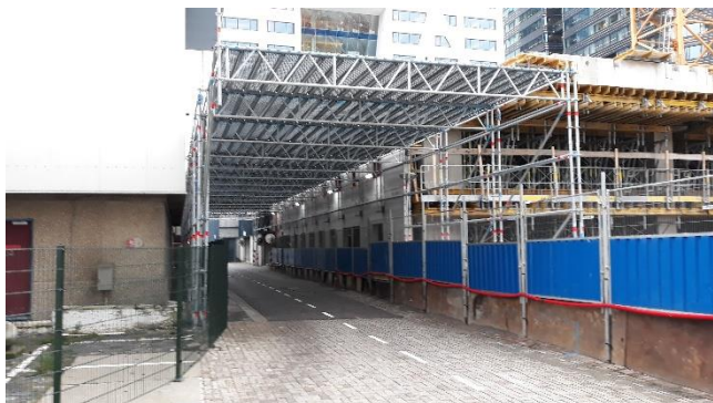
Afbeelding 2: het veiligheidsscherm in de steeg in de richting van het Stadskantoor.