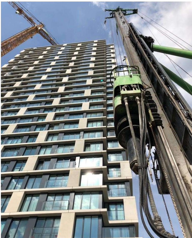
Afbeelding 3: Zware boormachines worden afgevoerd.