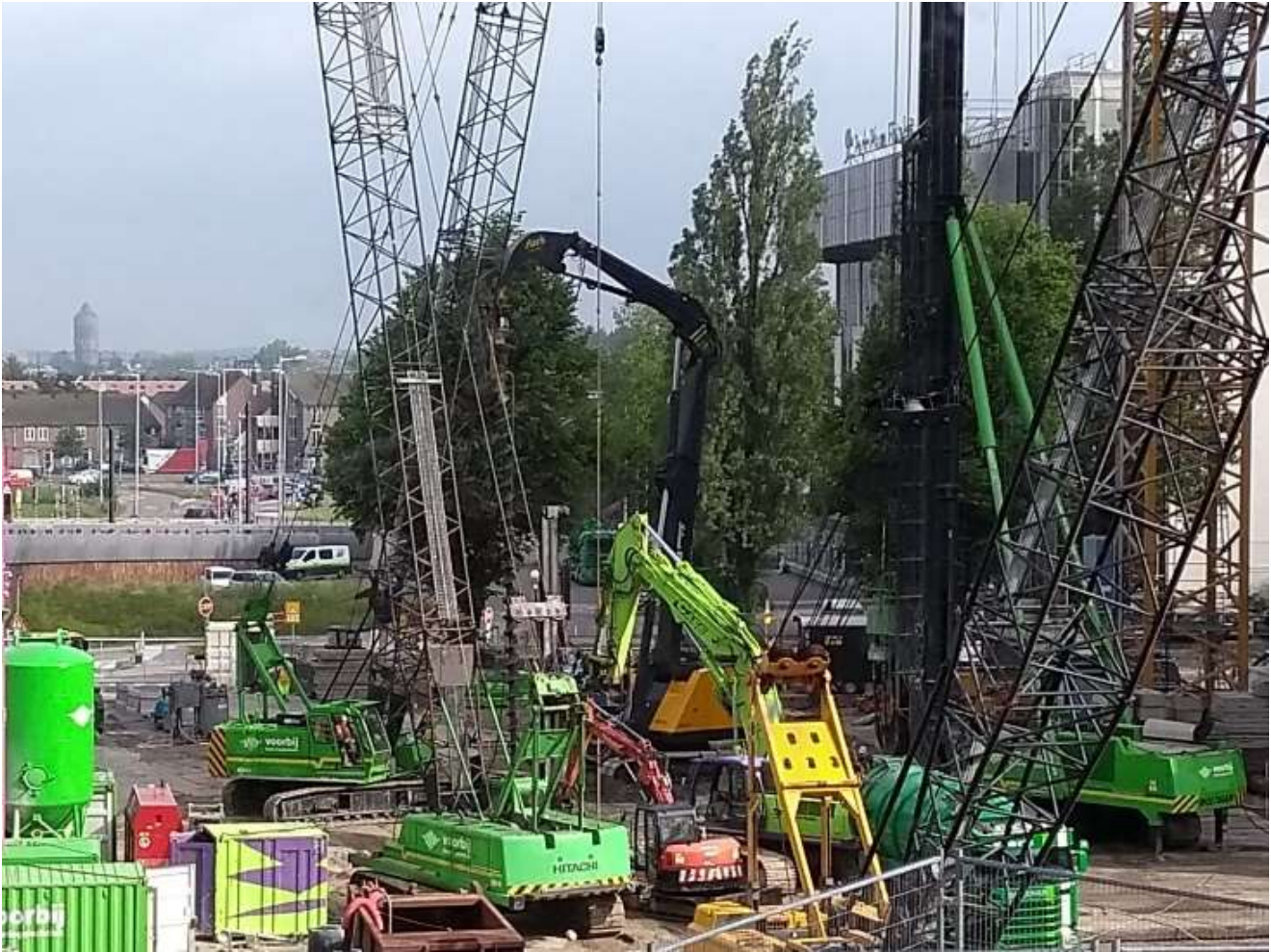
Afbeelding 7: De bouwplaats staat vol met 'zwaar' materieel om de fundatie te kunnen maken.