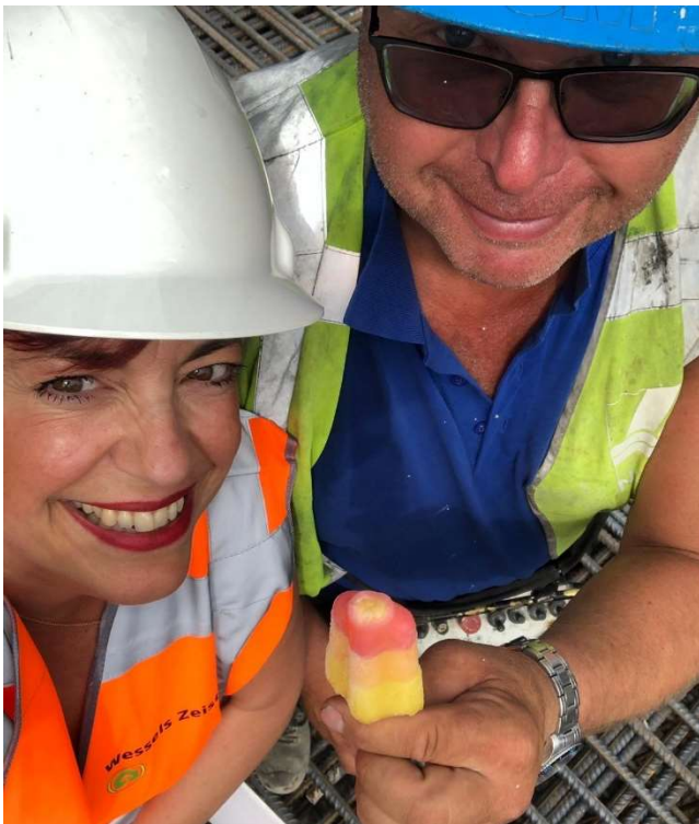
Afbeelding 1: doorwerken ondanks de warmte.

Aansluitend is het aanbrengen van de damwanden gestart. Zoals u wellicht heeft gezien wordt de ene 'grote' machine omgewisseld voor de andere grote machine.