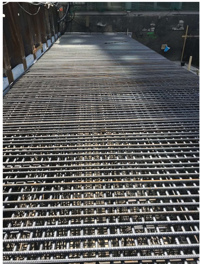
Afbeelding 5: Het maken van funderingen voor de kantoorstoren.