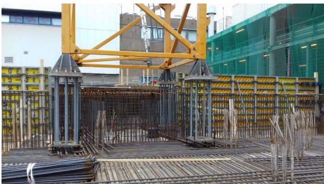
Afbeelding 4: Het onderstuk van de kraan wordt in beton gestort.